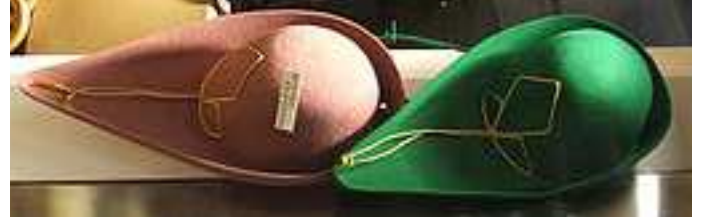
Felucce de sciences humaines et de sciences neuves.