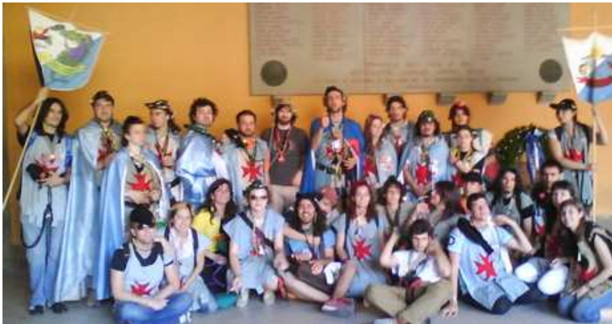
Mai 2009, les Goliards de la Res Publica Balla Pisana rendent hommage aux étudiants morts durant les guerres.

Les Goliards se regroupent en différents ordres selon leurs affinités et ces différents ordres sont régis par les « ordres de villes », présents dans chaque ville universitaire. Les chefs de villes ont généralement un nom qui se moque des symboles locaux (à Pise : Magnus Torrione, la grande tour).